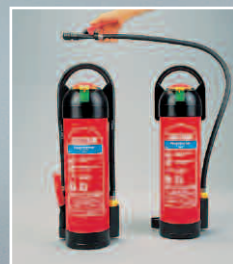
Abb. F 6 NI+