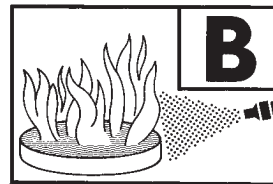
233 B = Typ PSE 9 G