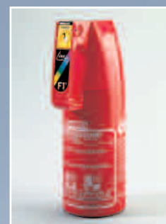
F 1 G