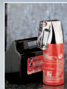
F 1 GM Exklusiv mit Manometer