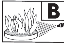
233 B (Typ SE 9 I)