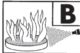
233 B (Typ SKK 6 LW)

Patenterte, wiederbefüll- und wieder- verwendbare Kolbenkartusche