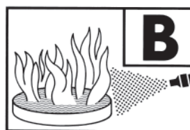
233 B = Typ F 6 SKK