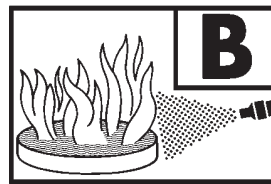
233 B = Typ PS 6 GX